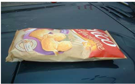
A 150m d'altitue