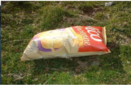
A 2000m d'altitue